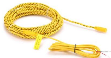
图 3 固定式感应线（出厂前已连接）